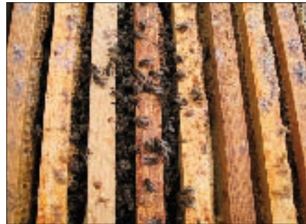
Typischer Hungertod: zahlreiche Bienen in den Wabengassen und keine verdeckelten Futterzellen.

In diesem Winter kam bereits VOR der Silvester-Party bei etlichen Imkern der große Katzenjammer. Ein prüfender Blick in die Beuten fiel allzu oft nur noch auf ein Häuflein Elend. Vor Einsetzen starken Flugbetriebes und möglicher Räuberei sollten diese wahrscheinlich inzwischen verstorbenen Völker abgeräumt werden. Das schützt sowohl den Frühjahrshonig als auch die Überlebenden vor unnötiger Belastung mit Krankheitserregern. Das gesamte Wabenwerk wird eingeschmolzen, die Rähmchen werden mit Natronlauge in der Spülmaschine gereinigt. Nur kotfreie Futterwaben werden aufbewahrt.