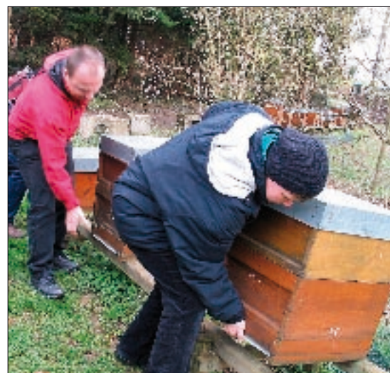
Mit etwas Erfahrung kann der Futterstand eines Volkes einfach an seinem Gewicht abgelesen werden (vorher Beschwerungsstein vom Deckel nehmen). Für Einsteiger empfiehlt es sich, den Futtermittelvorrat des leichtesten Volkes bei Flugwetter zu schätzen.