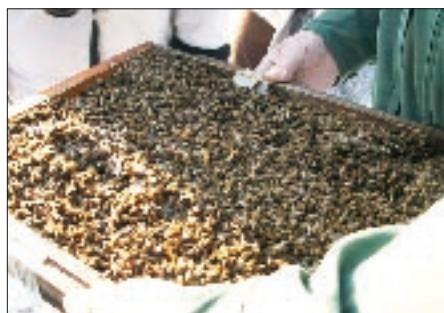
Wer dem Mäusegitter Fluglochkeile vorzieht, muss bei Flugwetter auf Verstopfung mit toten Bienen kontrollieren. Sonst droht Verbrausen.

beliebten) Eindruck, sie würden deren Tod herbeiführen. Dieser Bienenschwund ist nur für den einen oder anderen Großimker und US-Amerikaner „mysteriös“, dem aufmerksamen Hobby-Imker in „Good Old Europe“ ist er schon lange bekannt. Die wenigsten Todesfälle bleiben nach dieser Analyse ungeklärt. Beruhigend, denn meist sind weder mysteriöse neue Krankheitserreger noch vom Imker nicht beeinflussbare Faktoren wie „Stress“, Monokulturen, Pflanzenschutz, Grüne Gentechnik oder Handstrahlung für eine Erklärung