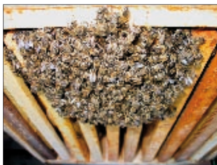
Wer von oben schwach aussieht, hat vielleicht tiefer liegende Vorzüge.

Wer keine Deckel heben oder Kästen ankippen möchte, erkennt bei Flugwetter (> 10°C, sonnig) die Wackelkandidaten auch am Flugbetrieb: Ohne vorherige Störung (kein Rauch, kein Verstellen der Flugschneise)