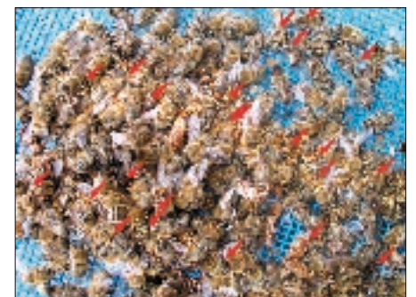
Typischer Varroa-Tod: ein jämmerliches Häuflein Bienen mit Königin auf einer Wabe und alte, nicht geschlüpfte Brutzellen. Im Totenfall sind bereits bei oberflächlicher Betrachtung verkrüppelte Bienen und mehr als 10 Milben (rote Pfeile) pro 100 Bienen zu erkennen.