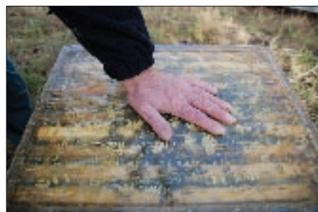
Die Temperatur verrät's: Dieses starke Volk auf 6 Wabengassen brütet bereits seit Weihnachten.

Das größte Sorgenkind des Bienenvaters sollte um diese Jahreszeit sein Nachbar sein. War der Winter lang anhaltend kalt, stehen die Bienen in den Startlöchern zum Reinigungsflug. Bis zur Hälfte ihres Körpergewichts haben sie an Kot gespeichert. Die geballte Ladung entsorgen sie bevorzugt auf Wäsche oder einem nach dem Frühjahrsputz erstrahlenden Auto. Eine kurze Warnung vor den stinkenden Spritzern, verbunden mit einem süßen Trostpflaster, hilft, den nachbarlichen Frieden zu erhalten.